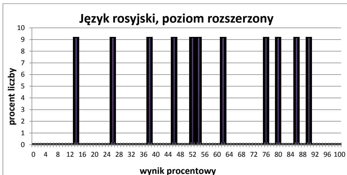
Wykres 3. Rozkład wyników zdających