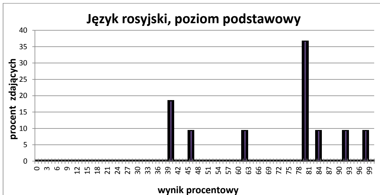
Wykres 1. Rozkład wyników zdających