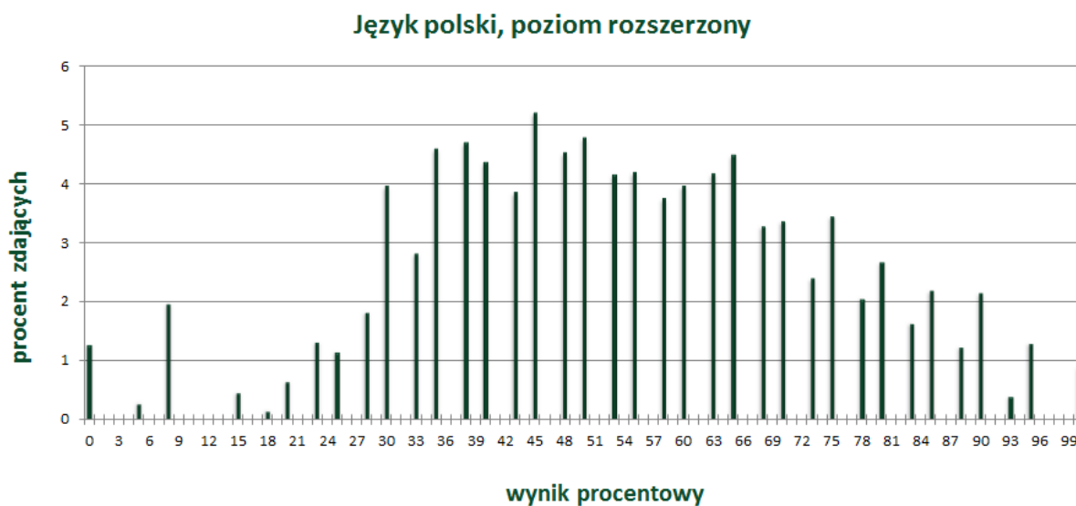
Wykres 3. Rozkład wyników zdających