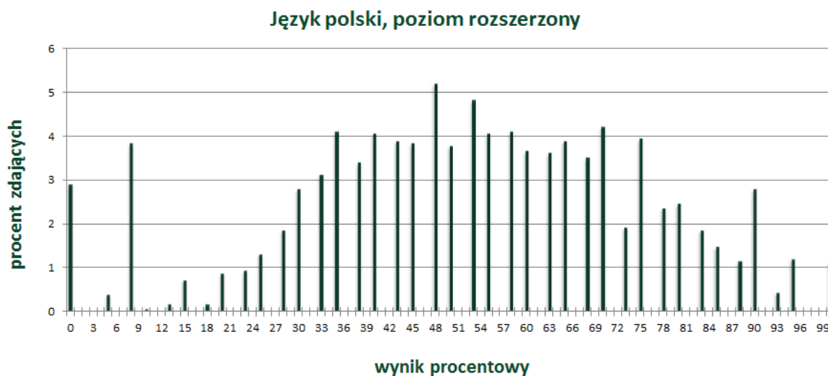
Wykres 3. Rozkład wyników zdających