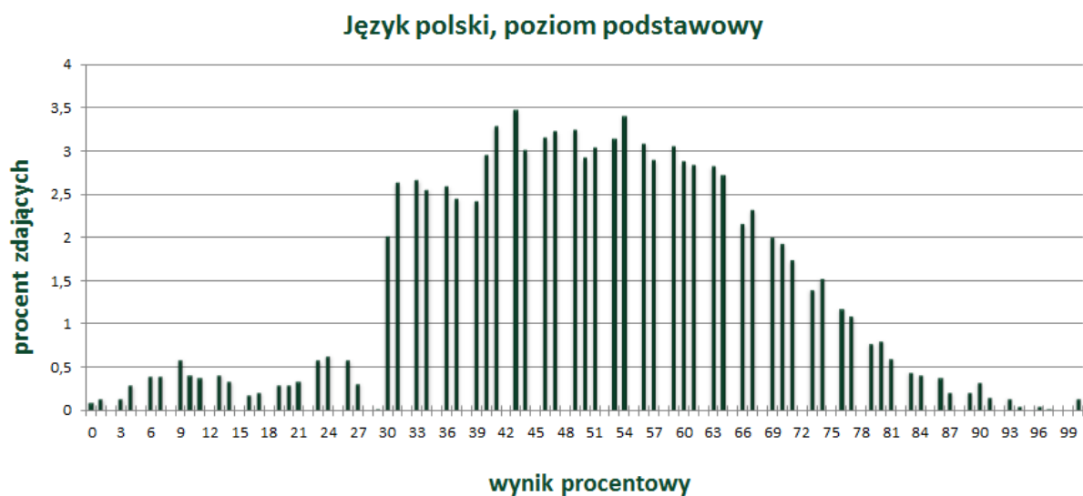
Wykres 1. Rozkład wyników zdających