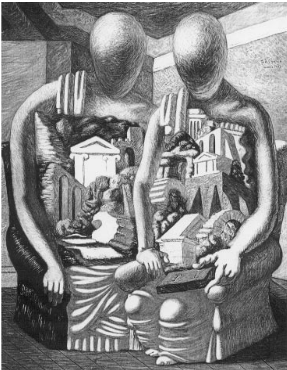
Giorgio de Chirico, Dwóch archeologów , [za:] Wielcy malarze , nr 133.