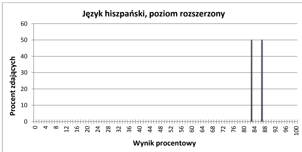
Wykres 1. Rozkład wyników zdających