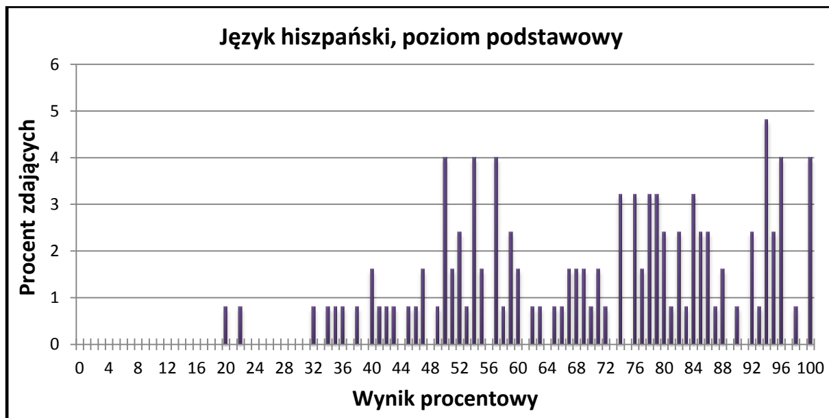
Wykres 1. Rozkład wyników zdających