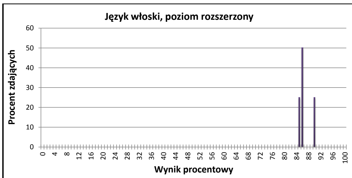
Wykres 1. Rozkład wyników zdających