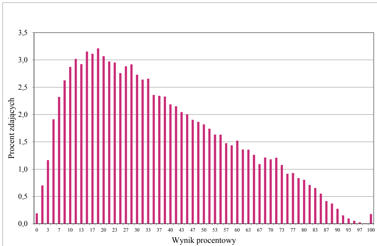
Wykres 1. Rozkład wyników zdających