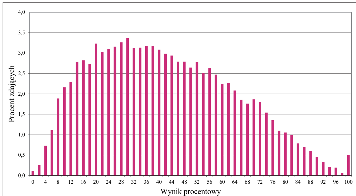
Wykres 1. Rozkład wyników zdających