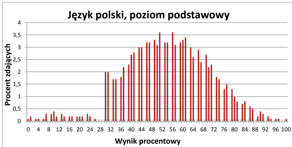
Wykres 1. Rozkład wyników zdających