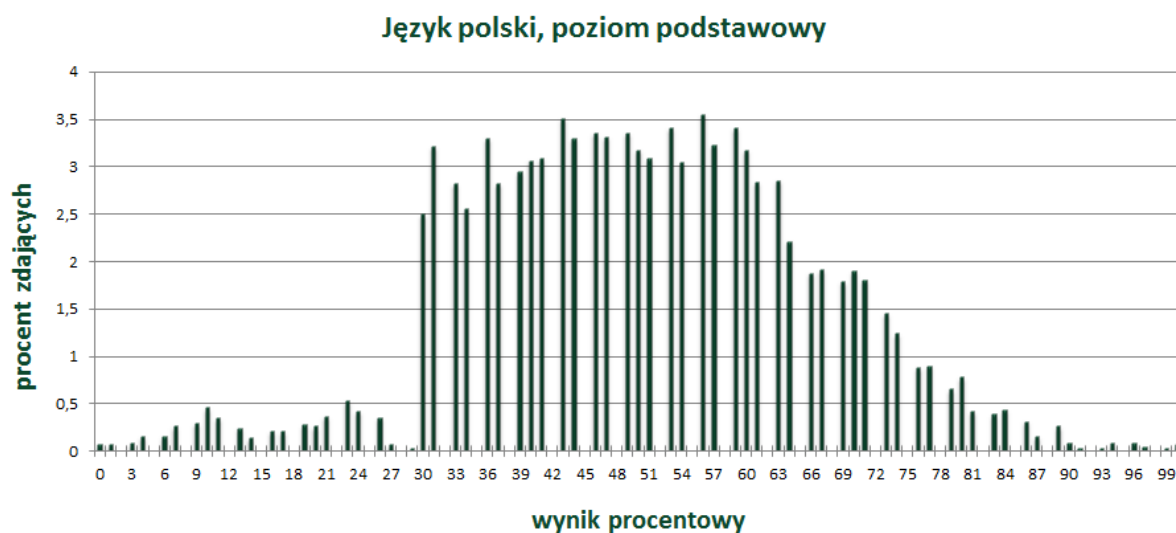
Wykres 1. Rozkład wyników zdających