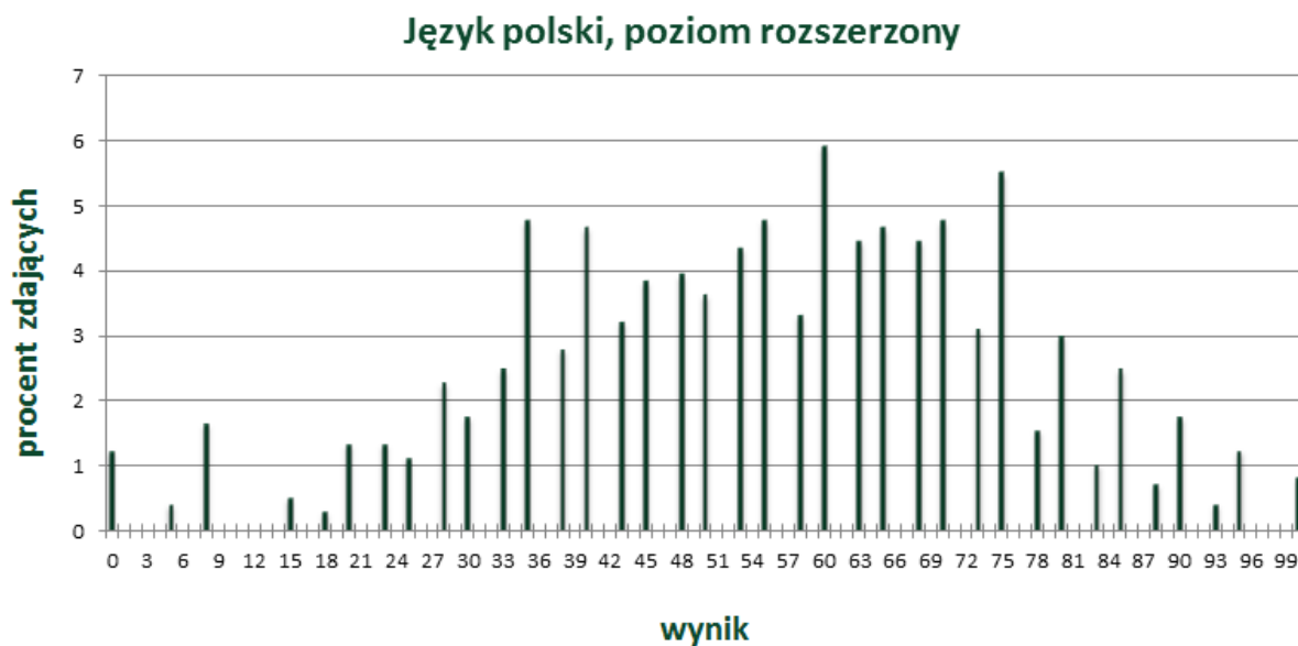
Wykres 3. Rozkład wyników zdających