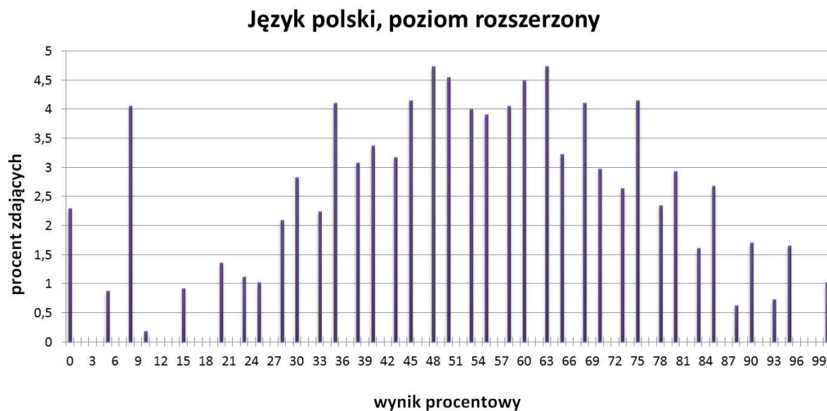
TABELA 9. WYNIKI ZDAJĄCYCH – PARAMETRY STATYSTYCZNE*