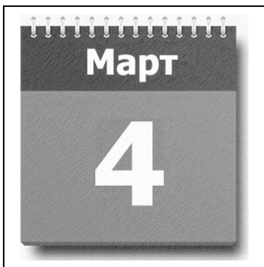
kartka z kalendarza 4 marca