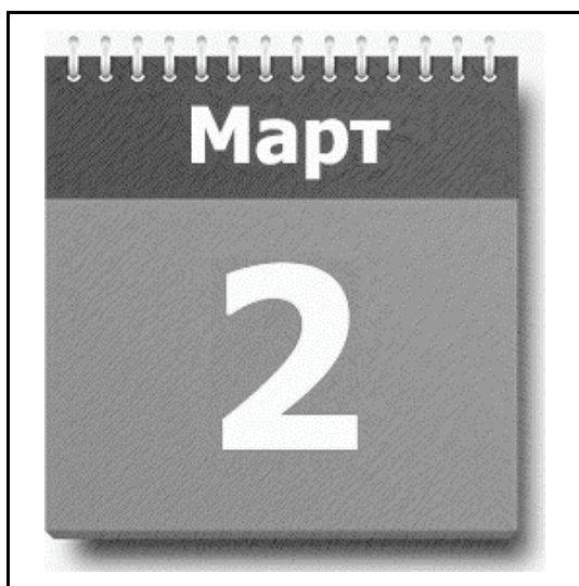
kartka z kalendarza 2 marca